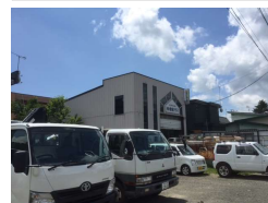
末広第1工場・倉庫