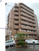
札幌Office 事務連絡所・社員福利厚生