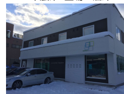
末広第2工場・倉庫